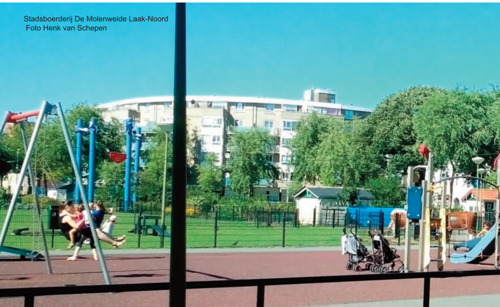
Stadsboerderij De Molenweide Laak-Noord

Groep de Mos is een partij met oog voor de vele expats in onze stad. Voor deze groep willen we de volgende verbeteringen doorvoeren: aanpak verkeersknelpunt bij de International School